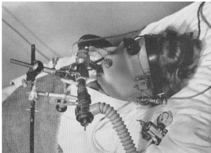
Fig. 2. Patiënt met fotocel op voorhoofd, 1958

Omdat de fotocel midden op het voorhoofd zat is het apparaat genoemd naar de mythologische éénogige reus. Het is niet bekend wat de patiënten daarover dachten. Zie fig. 2.