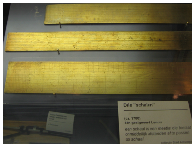
Figuur 1 : Drietel schalen, waarvan er een van Lenoir 1780